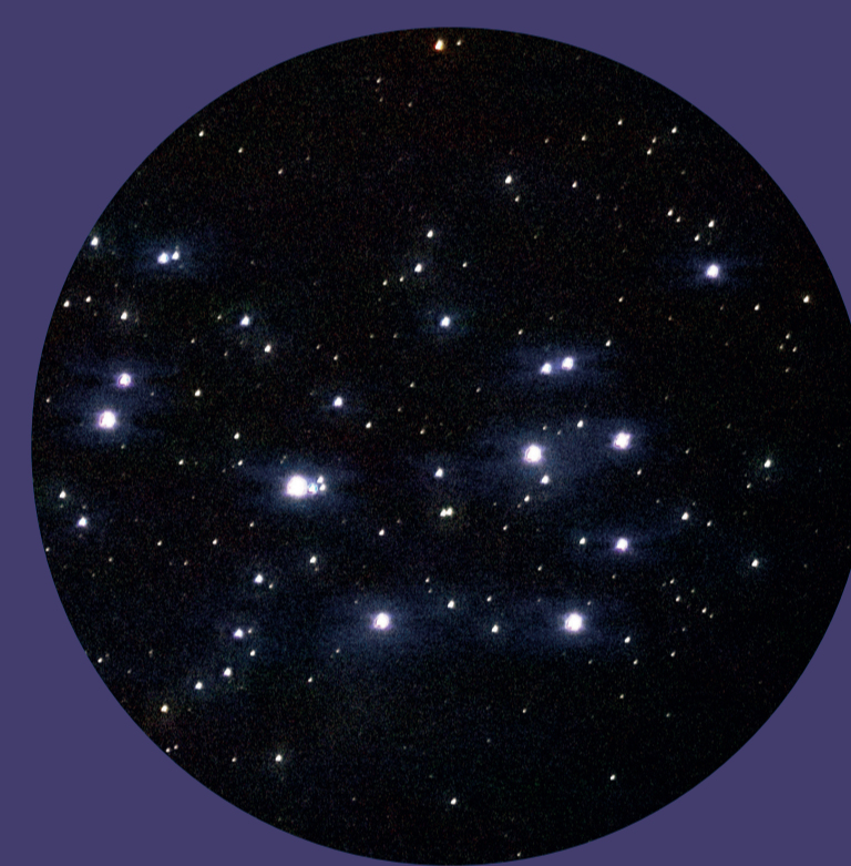
... und durch das Fernglas betrachtet.